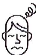
Vertiges / Nausées