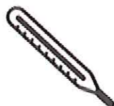
Fièvre > 38°C